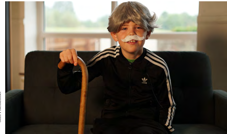
Still: I Remember