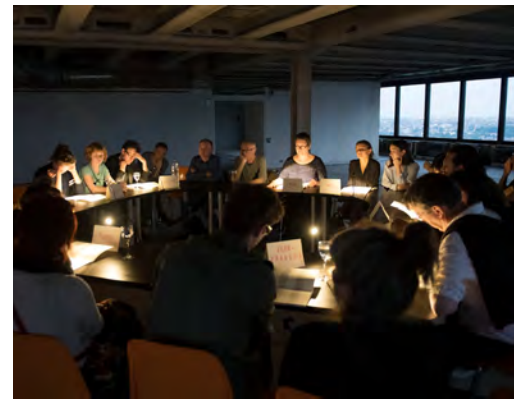
Your Word In My Mouth

In zahlreichen Gesprächen mit Theater- und Sozialwissenschaftler*innen, Theaterpädagog*innen, Künstler*innen und Theaterpraktiker*innen der Bürgerbühnen hinterfragten Hannes Langer und Katja Münster im Sommer 2021 die Institutionalisierung partizipativer Theaterkunst an deutschsprachigen Stadt- und Staatstheatern. Im daraus entstehenden Buch, das im Frühjahr 2023 im Beltz-Juventa Verlag erscheinen wird, geht es unter anderem um die Frage, ob sich partizipative Arbeitsweisen mit der inzwischen starken Institutionalisierung ebenjener Theaterformate vereinbaren lässt. Bei einem digitalen Frühstück stellt Hannes Langer erste Perspektiven aus ihren Interviews und Gesprächen vor.