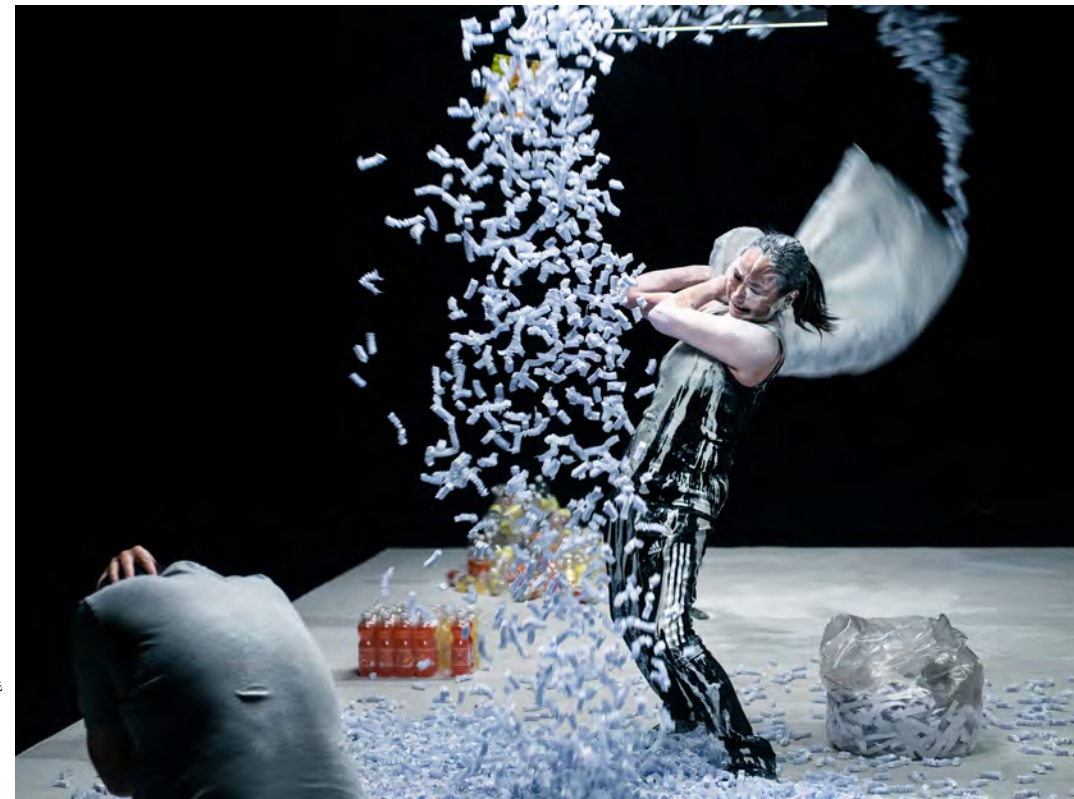
Stille Slag

Eine Produktion des Østerbro Teater Kopenhagen.